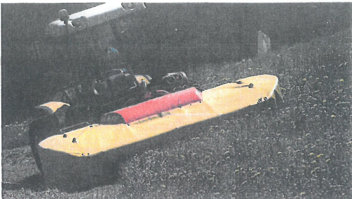
Rehos (240 cm)

Disková sekačka je určena k sečení vysoké trávy i v náročnějších horských podmínkách. K tomu je uzpůsobena svým kvalitním provedením a způsobem sečení, který je odlišný od bubnové sekačky. Stroj je agregovatelný na traktory s čelním třídobovým závěsem ISO 1 a lze jej použít i na traktory s otočným pracovištěm.