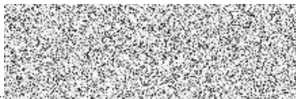
Razítko, podpis dodavatele