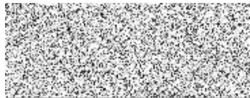
za objednatele/ Jaroslava Jarešová ředitelka odboru vnitřní správy